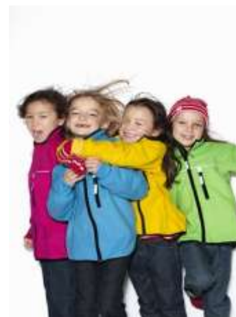
Polarn O. Pyret